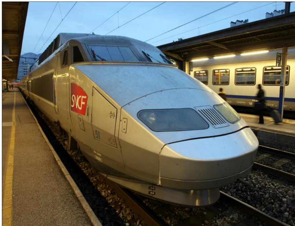
Depuis 2009, la desserte TGV d'Anancy est fragilisée, dénonce l'ARDSL, qui veut lui redonner toute sa place avec des TGV performants.

Pour y parvenir sans trop dépenser, l'ARDSL propose de repenser la répartition du