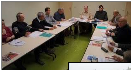
Notre réunion 5 fois par an

Ici l'ARDSL fait la promotion du Léman Epress au Salon du Développement Durable d'Annecy