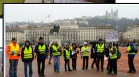
Opération de tractage sur Lyon pour demander davantage de train dans les Alpes (janvier 2015)