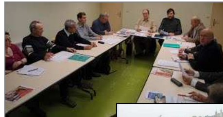
Notre réunion 5 fois par an