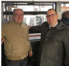
Ici le Vice-Président de l'ARDSL rencontre le Directeur Général de Lémanis afin de parler de la future desserte du Léman Express en janvier 2019.

L'ARDSL est la 1ère partenaire "usagers" de la Région Rhône-Alpes.