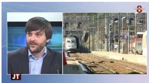
Le Président de l'ARDSL est interviewé sur la suppression du train de nuit et sur le Plan Rail 74.

Nous avons été à l'initiative de création de liaisons ferroviaires majeures dans le Sillon Alpin :