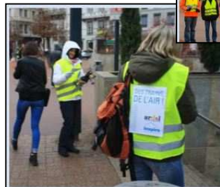
Opération de tractage sur Lyon pour demander davantage de train dans les Alpes (janvier 2015)

ARDSL - Janv. 19 - Merci de ne pas jeter sur la voie publique - Crédits photo : Chantal Boddard, TV8 Mont-Blanc, Cité Grenoble